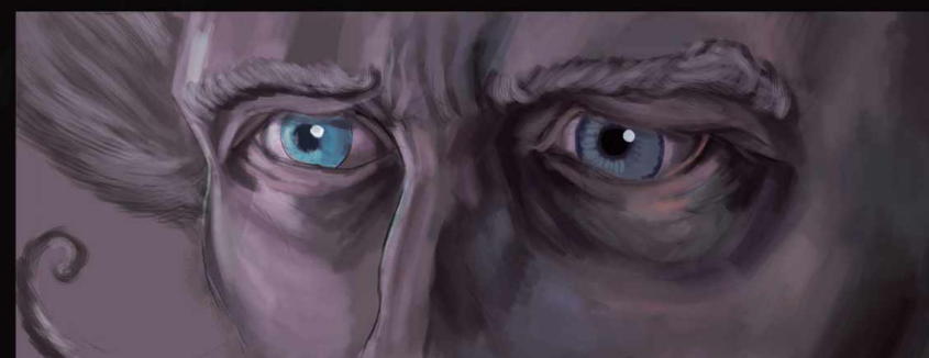
Ona już nie wróci, następnym razem ocknie się na własnym cmentarzu, lub tam dokąd zmierza...